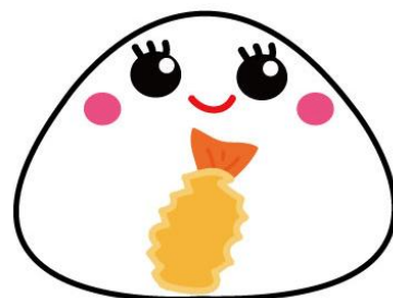
エビフライ・えびの天ぷら