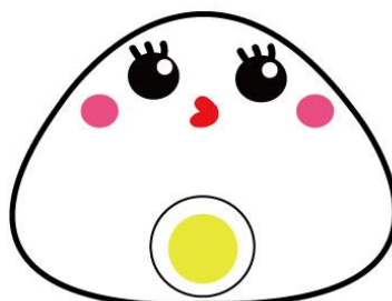
たまご・たまごやき