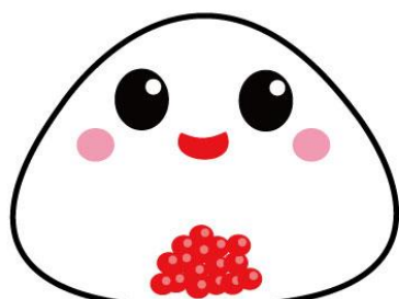
いくら・すじこ・たらこ