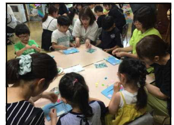
おやこで作品づくり