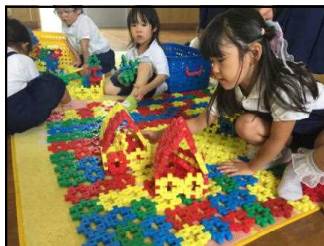
ブロックハウス完成!