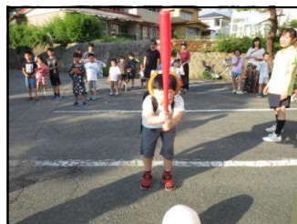
すいかわりをしたよ