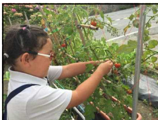
トマトができたよ

9月はわんぱくの森でばったやおおろぎなどの昆虫採集や幼虫から育ててきたかぶと虫のようすの変化など秋ならではの活動をします。こども達が、美しい秋空のもと、小さい秋をたくさん見付けながら夏から秋への移り変わりを体全体で感じ取ることができるように、また、園庭の小さな変化を見つめる目を大切に見守っていきたいと思います。2学期もご協力とご支援をよろしくお願いいたします。