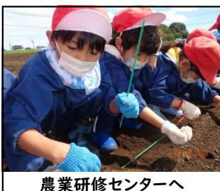
農業研修センターへ

本園でも、お孫さんの送迎や園庭での遊びにお付き合いしている祖父母の方々の姿を見て、ありがたく思っています。高齢者の皆様は、国や地域の伝統や精神文化を伝え、祖先からのいのちを今に受け継いでくれたかけがえのない方々です。今後も、子供からおじいさんおばあさんまで、協力し合いながら安心して暮らせる心豊かな社会を築いていきたいものです。