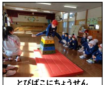
とびばこにちょうせん