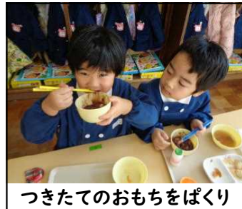
つきたてのおもちをぱくり