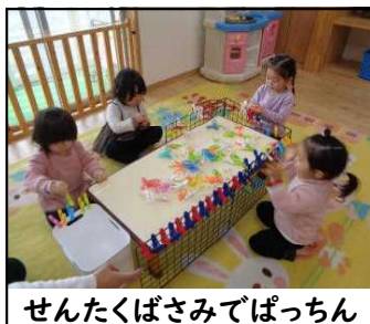
せんたくばさみでぱっちゃん