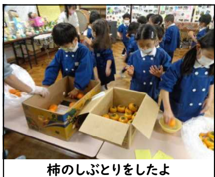
柿のしぶとりをしたよ

保護者ご家庭の皆様の方に笑顔の花束をお届けできるよう、残りの練習期間も一生懸命練習に励んでいきたいと思っています。発表会当日はステージ上で頑張る子ども達にたくさんの拍手をよろしくお願いいたします。