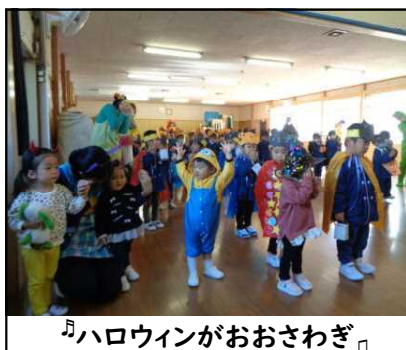
♪ハロウィンがおおさわぎ♪