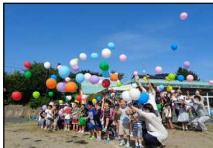
バルーンリリース