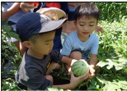
スイカの実ができてよ

子どもたちが、美しい秋空のもと、小さな秋をたくさん見付けながら夏から秋へと季節の移り変わりを感じ取ることができるように、また、園庭の小さな変化を見つめる目を大切に見守っていきたいと思います。