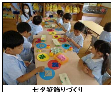
七夕笹飾りづくり